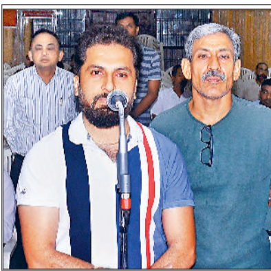
रोहतक। परिवेदना समिति की बैठक में शिकायत सुनते वित्तमंत्री जेपी दलाल। (इनसेट में) समिति के सामने समस्या बताता शहरी।

परिवेदना की समिति की बैठक में 11 शिकायतें रखी गईं, 10 का मौके पर समाधान