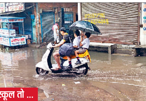
अब स्कूल तो ...

धान की रोपाई में तेजी : मौसम में बदलाव आने के बाद किसानों ने धान रोपाई के कार्य में तेजी ला दी है। कृषि विशेषज्ञों का कहना है कि अगले पांच-सात दिन में धान की अगोती किस्मों की रोपाई का कार्य पूरा कर लिया जाना